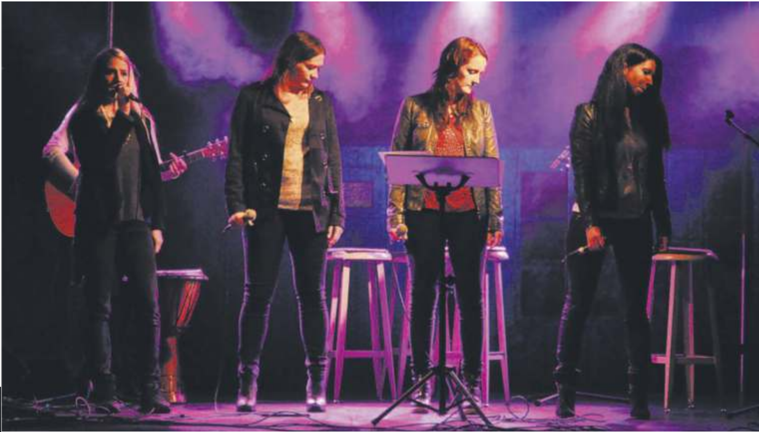
Harmonics ga oss en stor musikalisk opplevelse i Wesselgården.